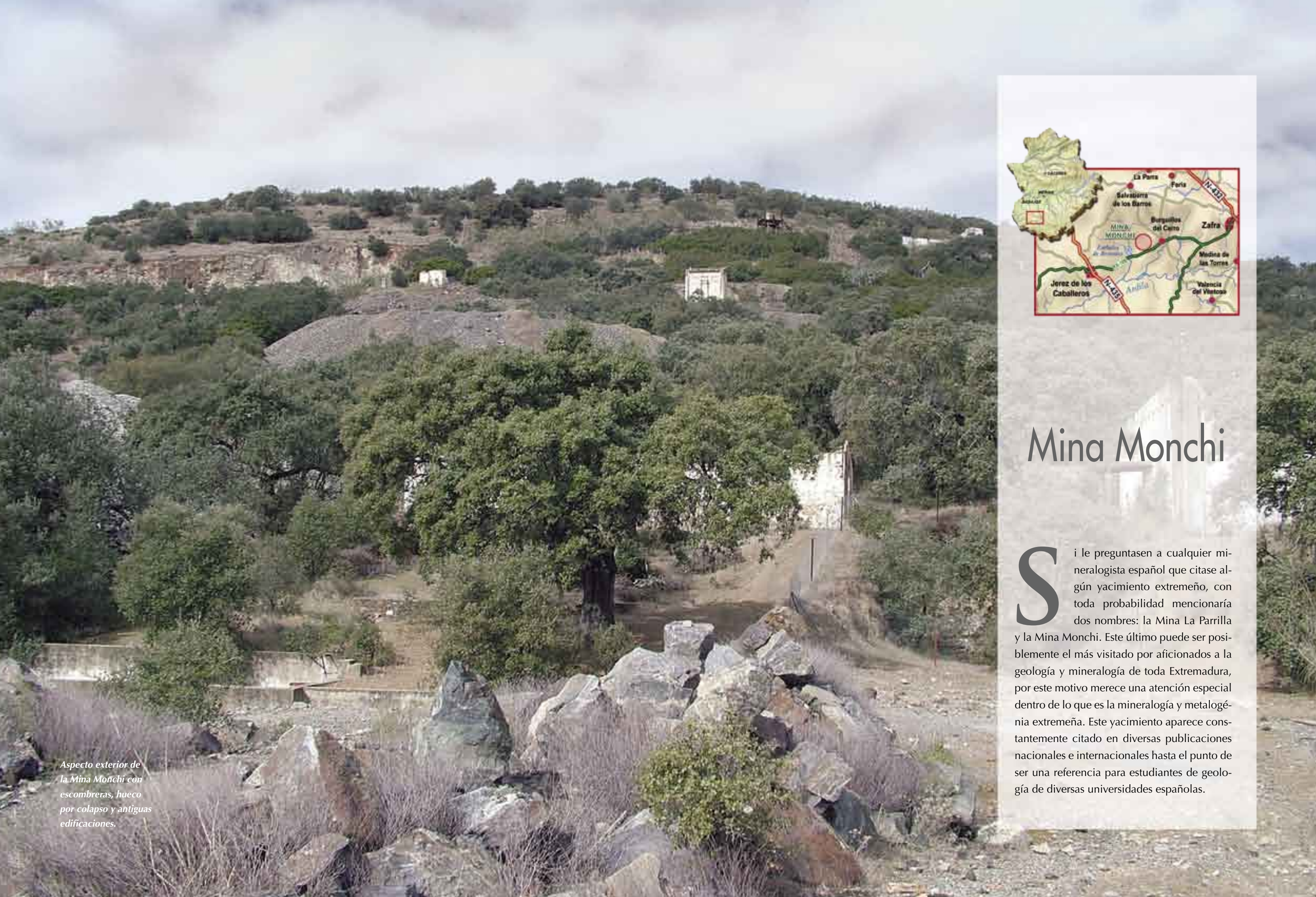
Aspecto exterior de la Mina Monchi con escombreras, hueco por colapso y antiguas edificaciones.