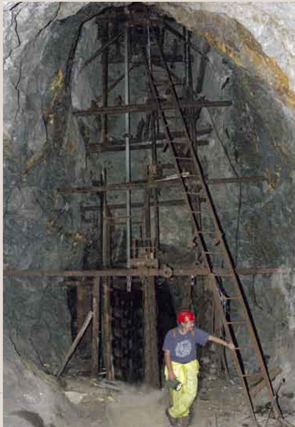
Como parte del patrimonio minero que aún preserva, se encuentra el castillete minero de interior.

Hacia el final de la galería principal se abren dos galerías perpendiculares, que atraviesan la Formación Carbonatada Cámbrica. En la galería que parte hacia la izquierda, la única con relativa seguridad para las visitas, podemos observar de cerca lo que puede ser el inicio de karst "antrópico", ya que se están formando estalactitas y velos, actualmente de escaso desarrollo, ya que