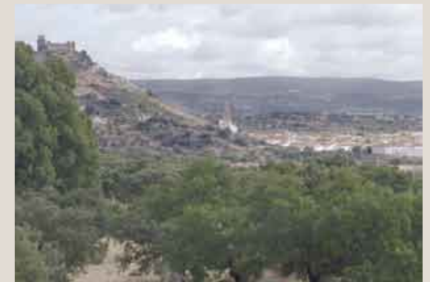
Panorámica de Burguillos del Cerro desde la mina.