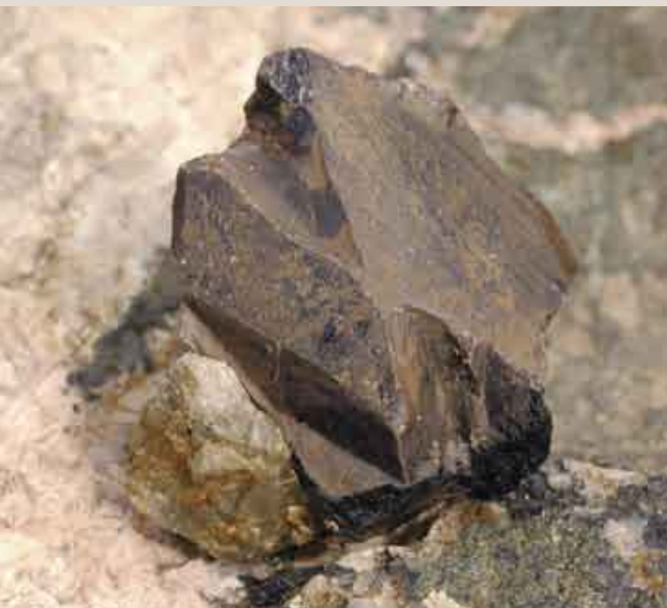
Macla de axinita.

Geológicamente la Mina Monchi pertenece a la Zona de Ossa-Morena, al dominio de Alconera-Arroyomolinos. Dentro de este dominio aparecen materiales del Precámbrico, Cámbrico, Devónico, Carbonífero, Terciario y Cuaternario. En la zona se pueden aislar una serie de afloramientos caracterizados por una estratigrafía específica de los materiales cámbricos encontrados, a los cuales se les da el rango de Formación. La que se encuentra dentro del dominio de la zona es la Formación Carbonatada Cámbrica de la Sierra del Cordel.