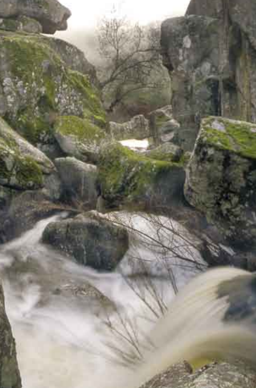
Arroyo de Las Muelas a su paso por el berrocal de "El Rugidero" en el Parque Natural de Cornalvo.