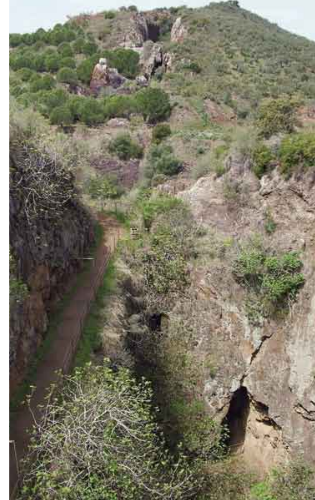
"Mina La Jayona". Monumento Natural.

Recientemente se ha introducido el término georrecurso cultural , entendiéndose por tal el elemento, conjunto de elementos, lugares o espacios de alto valor geológico que cumplan, al menos, la condición de presentar un elevado valor científico, didáctico y, por tanto, deban ser objeto de una protección adecuada y de una gestión específica, o que sean susceptibles de ser utilizados y gestionados como recurso cultural con la finalidad de incrementar la capacidad de atracción