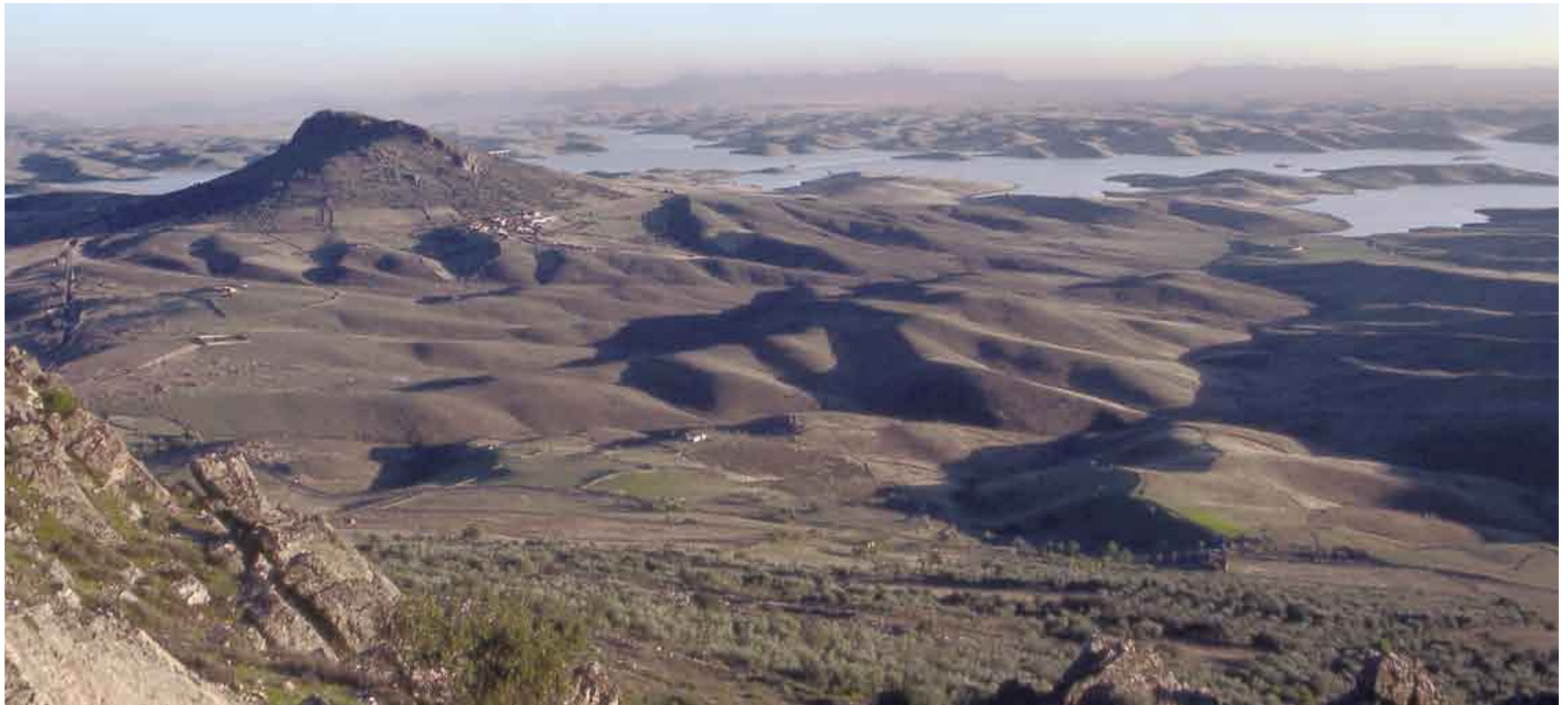
Panorámica de “La Serena y Sierra de Tiros”. Z.E.P.A.

En cuanto a protección de los valores geológicos del territorio, no hay que olvidar las extensas superficies declaradas como Zonas de Especial Protección para las Aves (Z.E.P.A.) en virtud de la Directiva de Aves: Embalse de Orellana y Sierra de Pela, Llanos de Cáceres y Sierra de Fuentes, Sierra de San Pedro, Sierra Grande de Hornachos, La Serena y Sierra de Tiros. Todas se declaran por