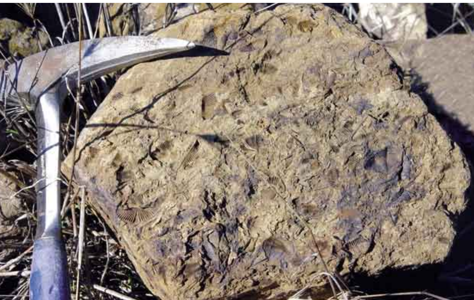
Fósiles del Devónico Superior. Cabeza del Buey.

En este sentido, los georrecursos constituyen un medio de desarrollo importante para el ámbito en el que se insertan. La puesta en valor de estos recursos ambientales va cobrando cada vez mayor significación, sirviendo de impulso económico para muchas locali-