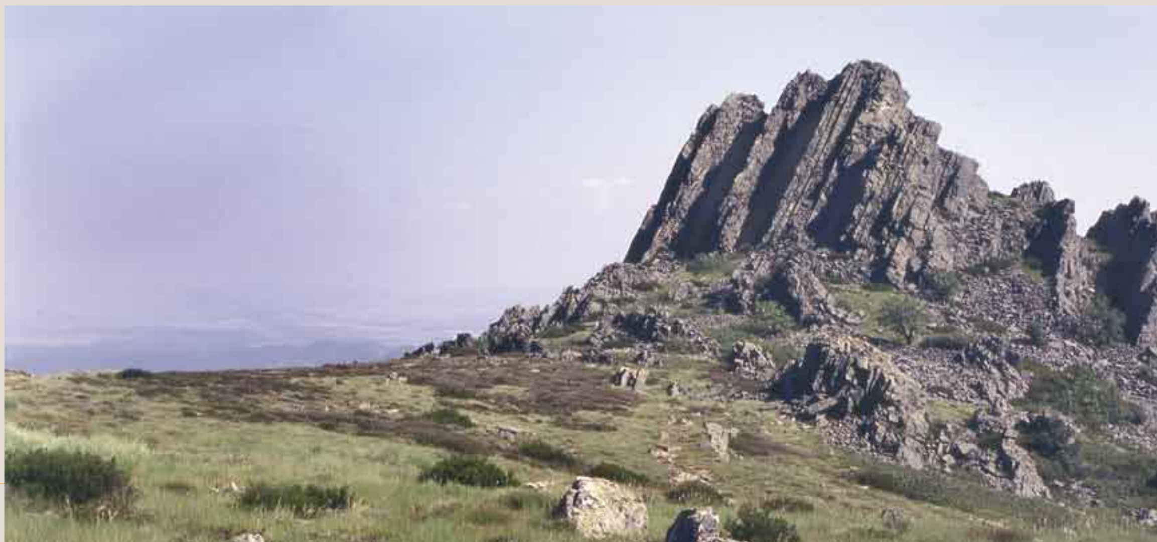
Resalte de cuarcita armoricana donde se aprecia el buzamiento casi vertical de los estratos.

En la zona del Hospital del Obispo existen muestras, prácticamente relictas, de períodos climáticos terciarios más fríos y húmedos que los actuales. Son las turberas o “trampales”. Se han generado en zonas con cierto grado de encharcamiento, zonas que recogen el agua de drenaje de las partes altas de la sierra. En ellas se da un tipo de vegetación perfectamente adaptada a estas condiciones edáficas especiales, que en algunos casos constituyen endemismos botánicos, de gran importancia cultural y científica. Su estudio permite extraer datos muy interesantes sobre paleobotánica y paleoclimatología.