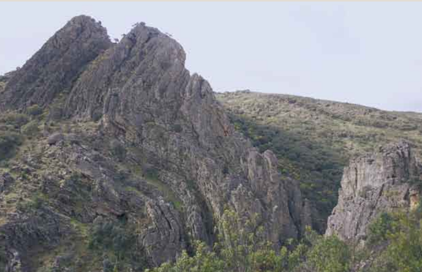
Portilla del Almonte. La erosión del río ha dejado al descubierto este espectacular pliegue visible en un cortado de más de un centenar de metros de altura.

Los anticlinales y sinclinales paralelamente alineados fueron arrasados por la erosión durante millones de años (fundamentalmente durante la Era Secundaria). Un posterior levantamiento de la región y los subsiguientes procesos geológicos han configurado la actual geomorfo-