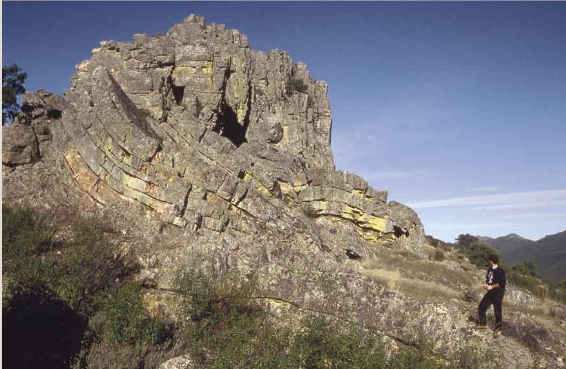
Pliegue de cuarcitas del Ordovícico en el sinclinal de Santa Lucía. Cabañas del Castillo.

el origen de los valles que ocupan núcleos de anticlinales, como son los casos de los ríos Ibor y Almonte). Otro grupo de fracturas se dispone transversal y diagonalmente a las alineaciones predominantes, haciéndose notar especialmente cuando la fractura ha producido desplazamiento horizontal de los materiales,