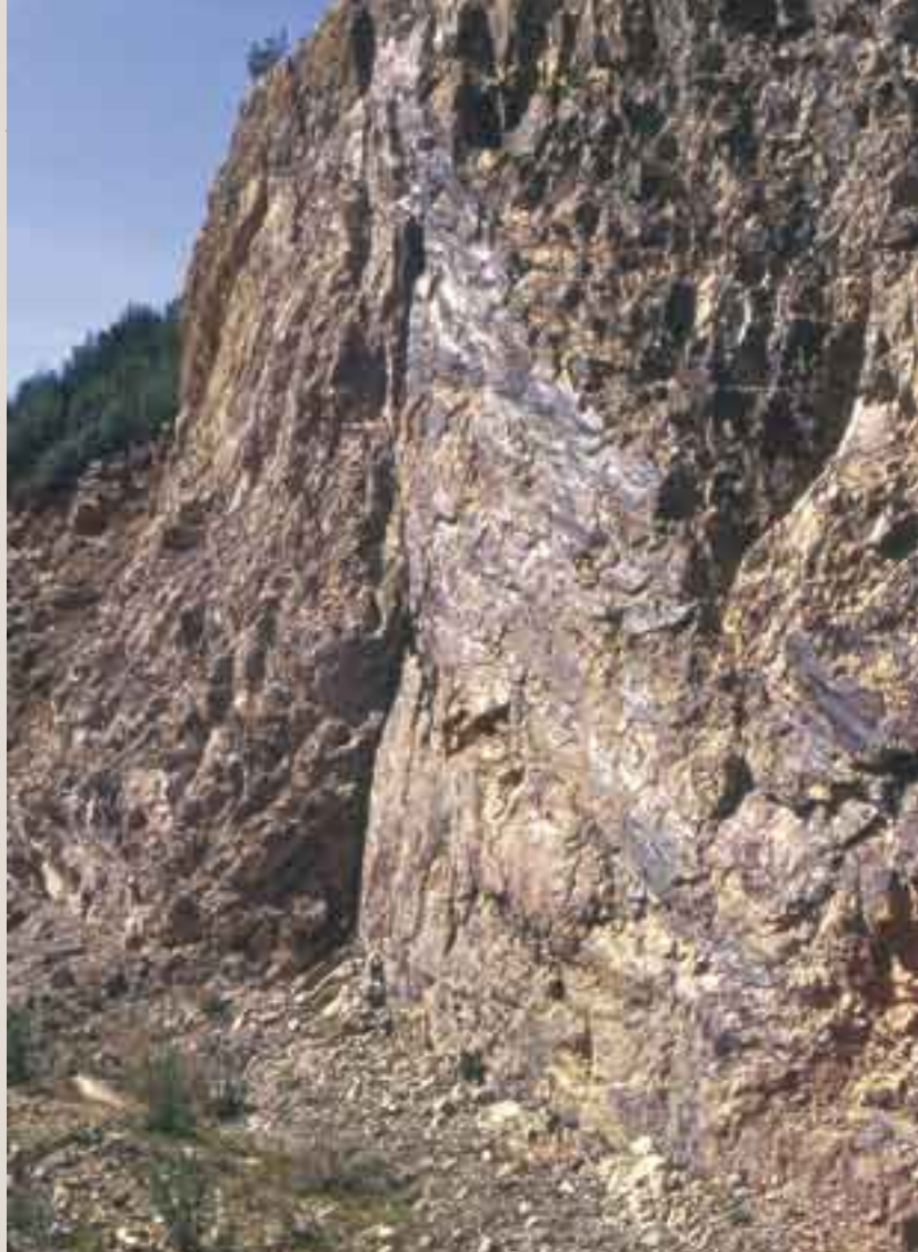
Espejo de falla donde son visibles las estrías que indican la dirección del movimiento de los bloques. Río Viejas.

En este caso el espejo de falla se produce a favor de una superficie de fractura, en donde son visibles incluso las estrías de falla, lo cual permite interpretar claramente la dirección de desplazamiento de los bloques. La fractura puede haber sido un motivo aprovechado por el cauce fluvial del río Viejas para unir su curso al Ibor unos centenares de metros más allá.