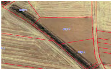
Recinto de Tierra Arable incorrectamente delimitado