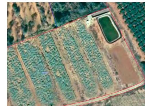
Recinto de tierra arable con alberca correctamente delimitada tras la presentación de la alegación