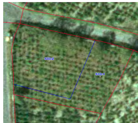
Recinto del improductivo mostrado por el visor del SIGPAC tras la actualización de la ortofoto