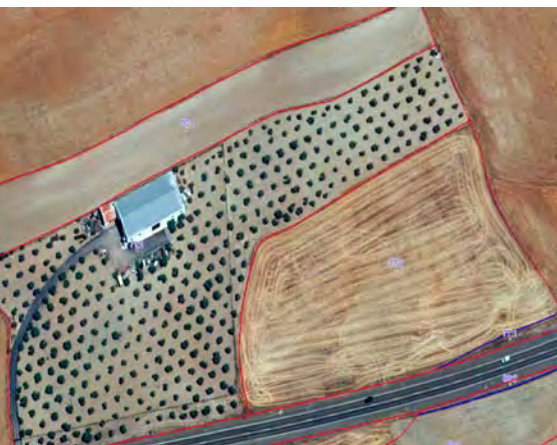
Recinto de Olivar correctamente delimitado con un vial y una edificación descontados