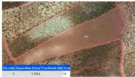
Recinto con un cambio de uso. Situación en SIGPAC antes de alegación 2011